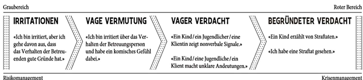
Grafik (Fachstelle Limita, Iten Karin (www.limita.ch))